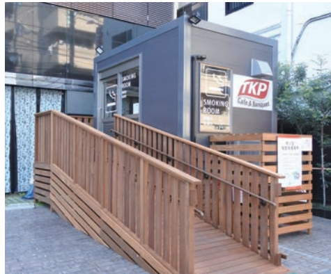
車検付で場所を問わず自由に移動可能