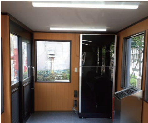
屋外に設置出来る「屋内型」喫煙スペース