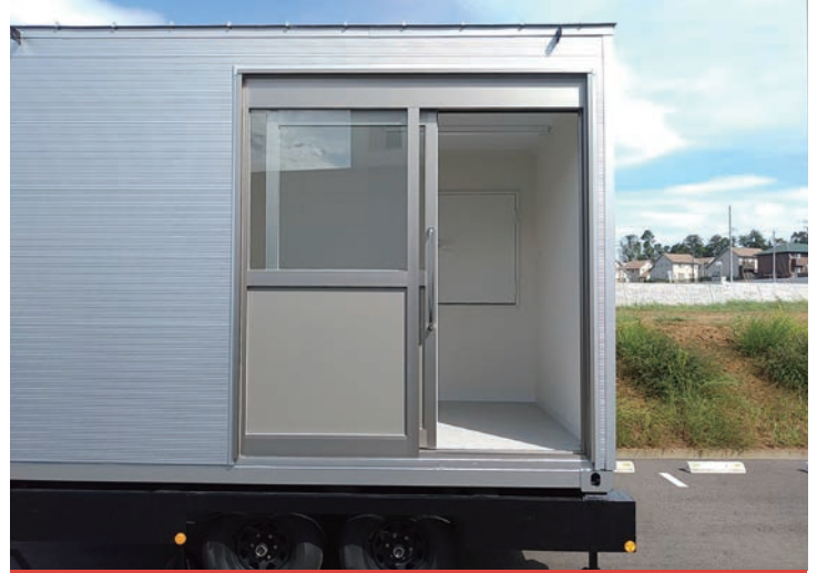
半自動ドアで、スムーズな開閉

陰圧装置により陰圧を発生させると同時に、HEPAフィルターでろ過した空気を屋外に排出します。空気の流れを一定方向に制御し、安全に配慮した設計です。